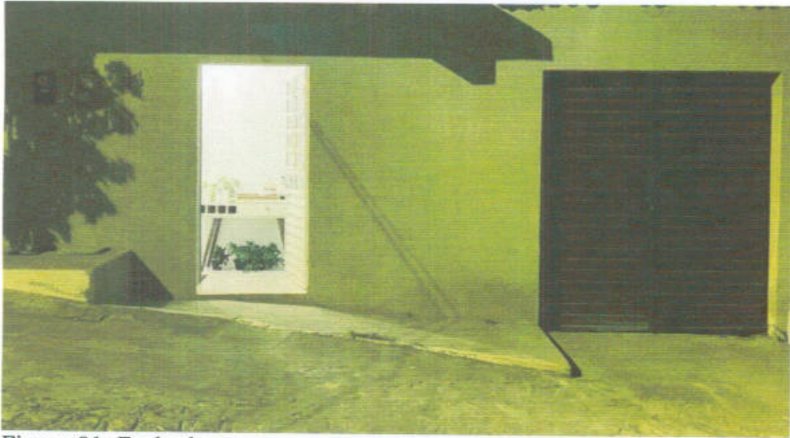
Figura 01: Fachada.