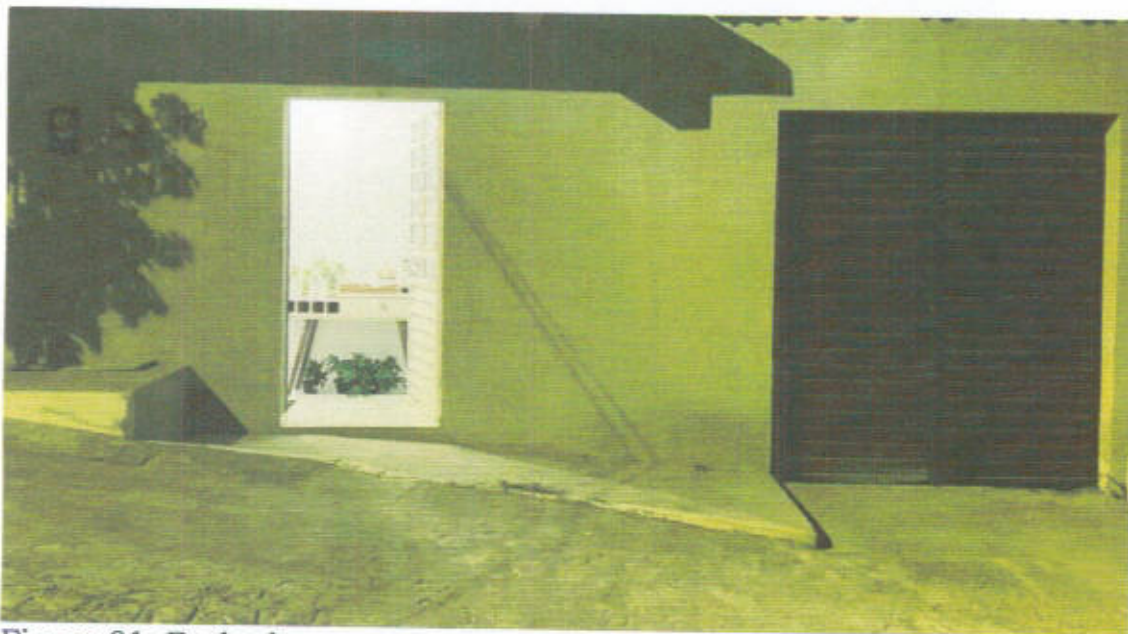
Figura 01: Fachada.