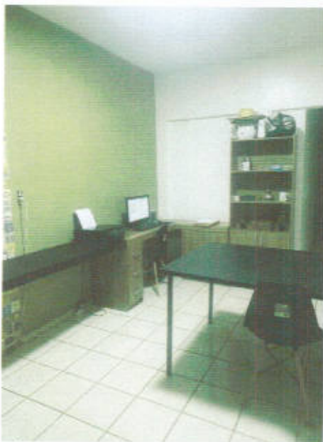
Figura 02: Interior.