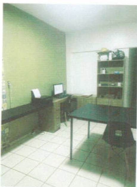
Figura 02: Interior.