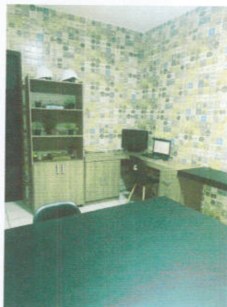
Figura 03: Interior.