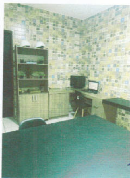
Figura 03: Interior.