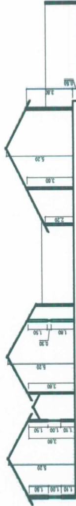
CORTE_AA ESCALA 1/200