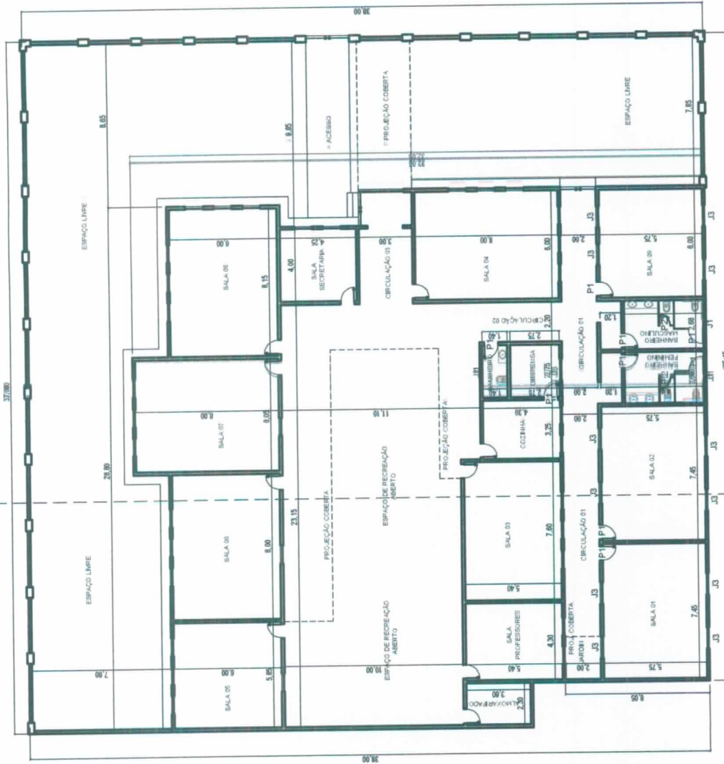
PLANTA BAIXA _ LAYOUT ESCALA 1/200